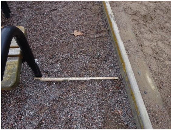
Fel nummer 5.1