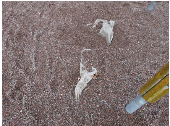
Fel nummer 3.2