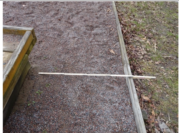
Fel nummer 5.1