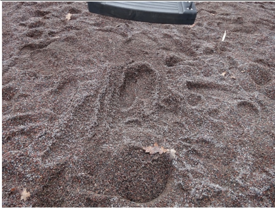
Fel nummer 3.2